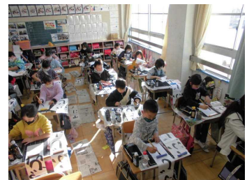
初めての毛筆(3年生) ↑

1月8日(金)に書き初め会を行いました。1・2年生は硬筆、3年生以上は毛筆で各学年の課題となつている文章や文字を書きました。どの学年、どの学級も静かに、時間ギリギリまで集中して取り組んでいました。子どもたちの力作は、1月21日(木)、22日(金)の2日間、体育館に展示します。ぜひご覧ください。