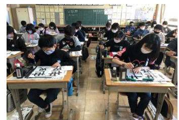
小学校最後の書き初め ↑ (6年生)